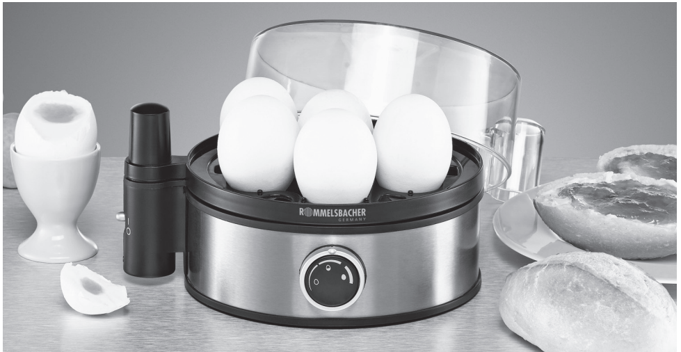
ER 400 Eierkocher Egg boiler